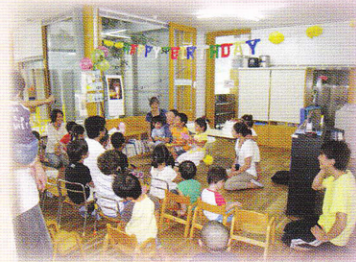
愛されて育つ子どもたちの誕生日会