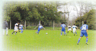
ボカユースのトップチームと対戦