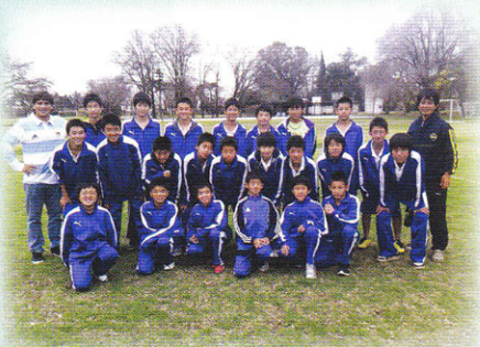
アルゼンチン研修は 総勢25名(過去最多)が参加しました。