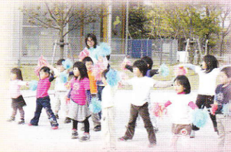
運動会のダンス、いっぱい練習しました!